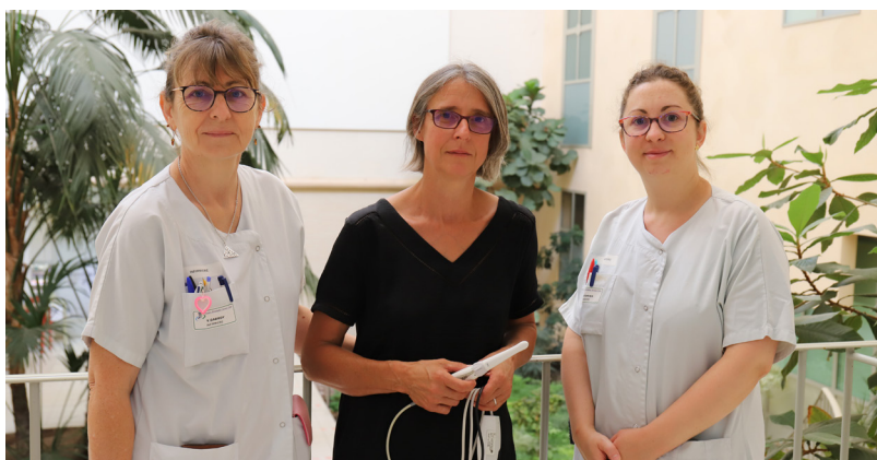
Les infirmières du dépistage bucco-dentaire

Ce projet, financé pendant quatre ans dans le cadre de l'Article 51 de la Loi de Financement de la Sécurité Sociale (LFSS) pour 2018 (le premier dans la région Centre-Val de Loire), a été salué au niveau national pour ses résultats positifs, ainsi que son caractère innovant et reproductible sur l'ensemble du territoire français. Le 11 juillet 2023, le Comité Technique de l'Innovation en Santé (CTIS) a émis un avis favorable sur l'opportunité de généraliser l'expérimentation.