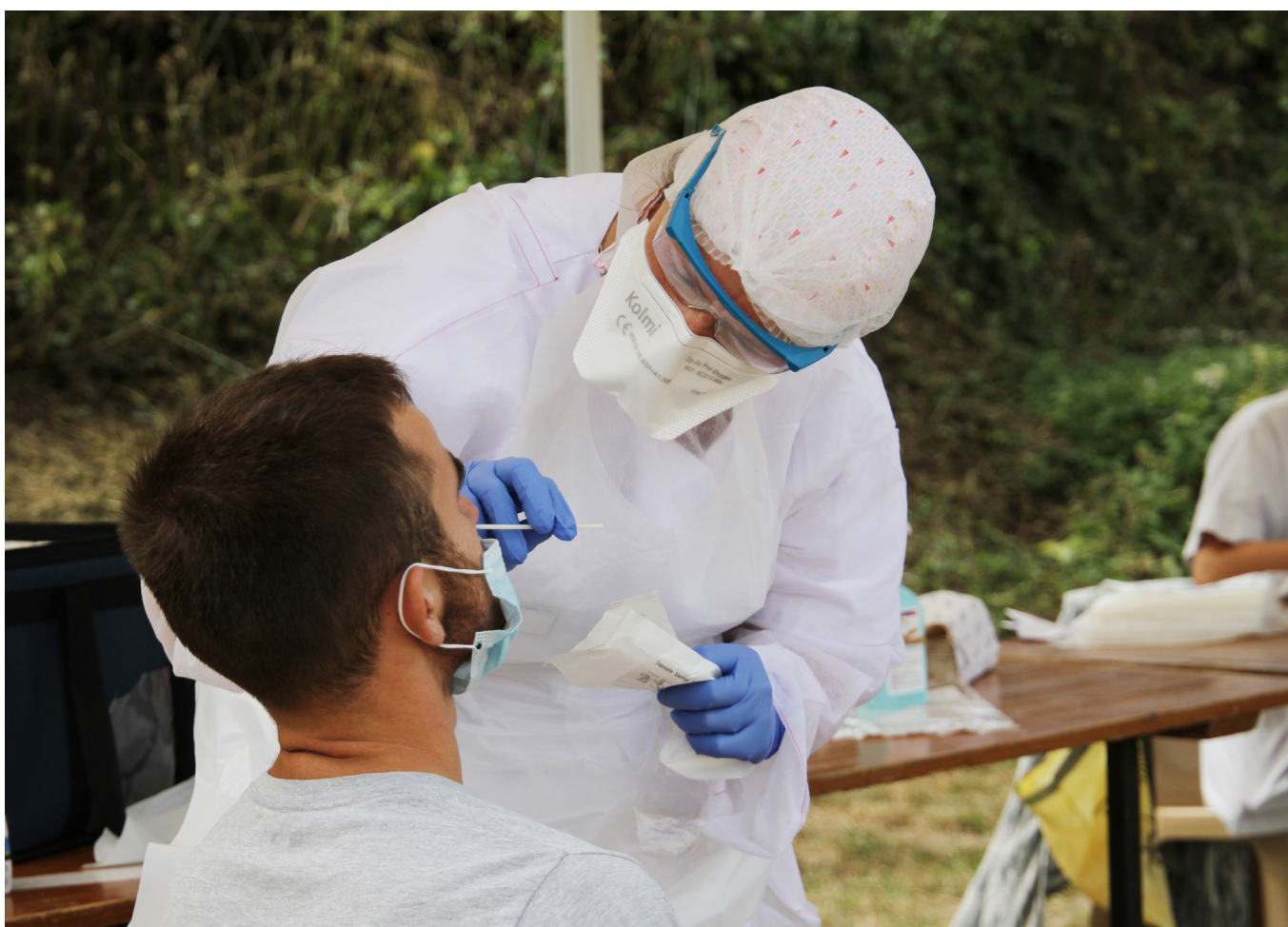
Les équipes de l'hôpital mobilisées lors d'opérations de dépistages gratuits de la Covid-19, ici à Sancerre, le 27 août 2020.

Fin août, des professionnels hospitaliers ont réalisé des prélèvements dans plusieurs communes du département du Cher (Saint-Martin-d'Auxigny, Menetou-Salon, Sancerre) lors d'opérations de dépistages de la Covid-19. La population était au rendez-vous puisqu'au total, ce sont plus de 480 dépistages qui ont été réalisés par les équipes du Centre Hospitalier Jacques Coeur, du 25 au 27 août. Ces opérations ont nécessité l'aide et l'engagement de plusieurs services, comme le laboratoire de biologie médicale, l'équipe mobile de dépistage territorial et le bureau des consultations et des hospitalisations.