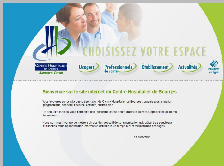
La page d'accueil de l'ancien site Internet de l'établissement

Afin de faciliter la navigation des internautes, l'arborescence du nouveau site est constituée de trois parties principales : « Le CH Jacques Cœur » pour les informations institutionnelles ; « Je viens à l'hôpital » pour les informations sur les consultations et le séjour à l'hôpital ; et « Recrutement et Formation » pour les offres d'emploi, les stages et les informations sur la formation d'aide-soignant(e). De plus, un module de recherche sur les services de soins et les professionnels de santé qui réalisent des consultations est accessible sur toutes les pages du site.