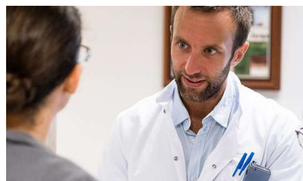
1. Validation médicale