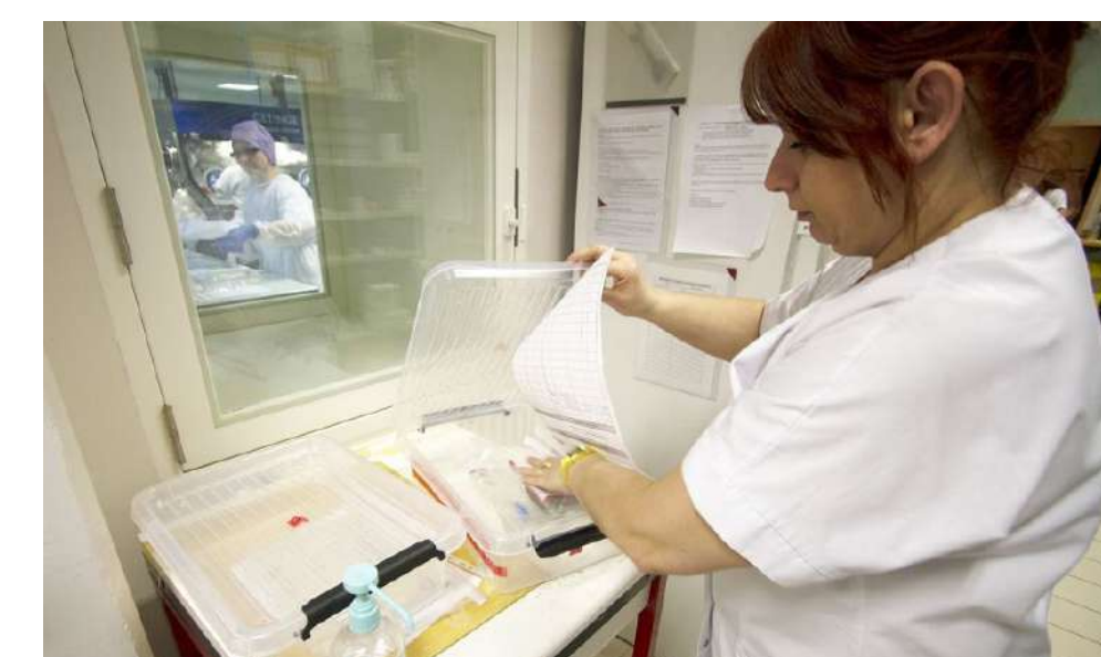
5. Acheminement dans le service de soin (manutention automatisée ou livraison manuelle)