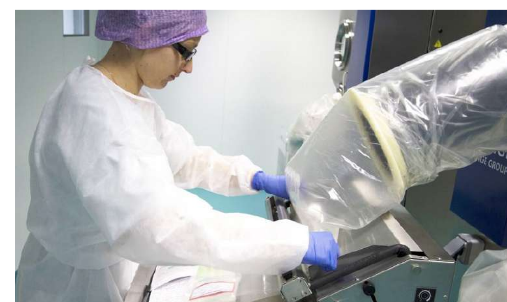
4. Vérification de la conformité de la préparation et de l'étiquetage, pour une sécurité maximale