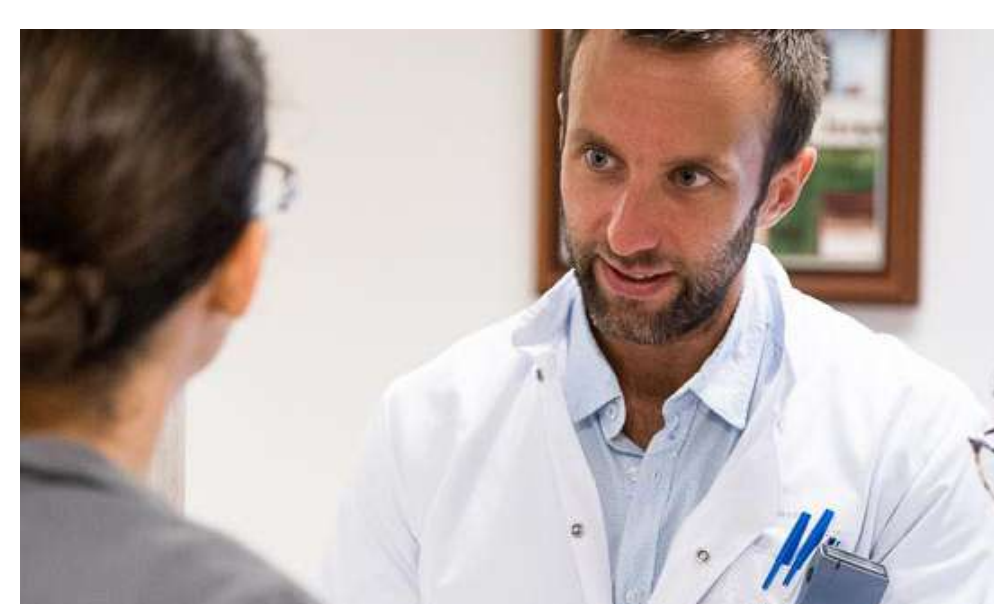
1. Validation médicale