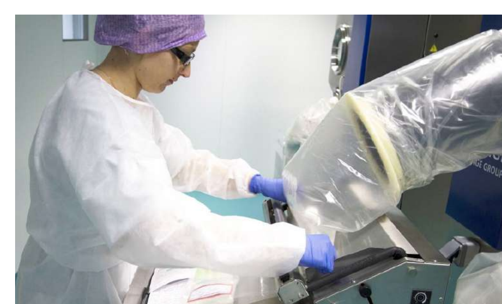
4. Vérification de la conformité de la préparation et de l'étiquetage, pour une sécurité maximale