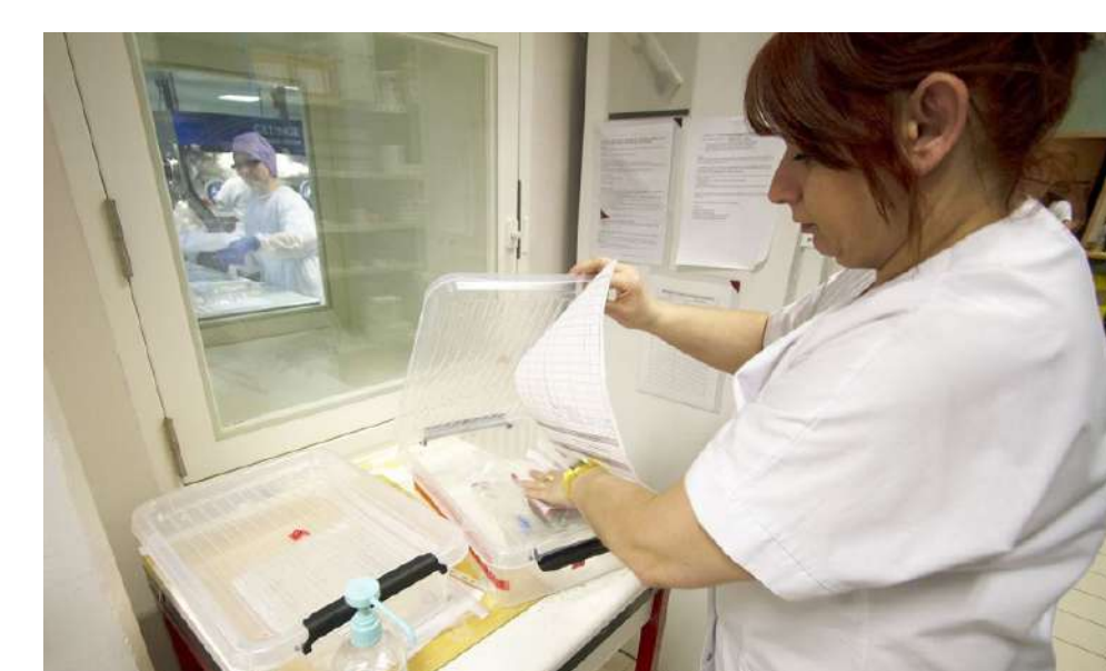
5. Acheminement dans le service de soin (manutention automatisée ou livraison manuelle)