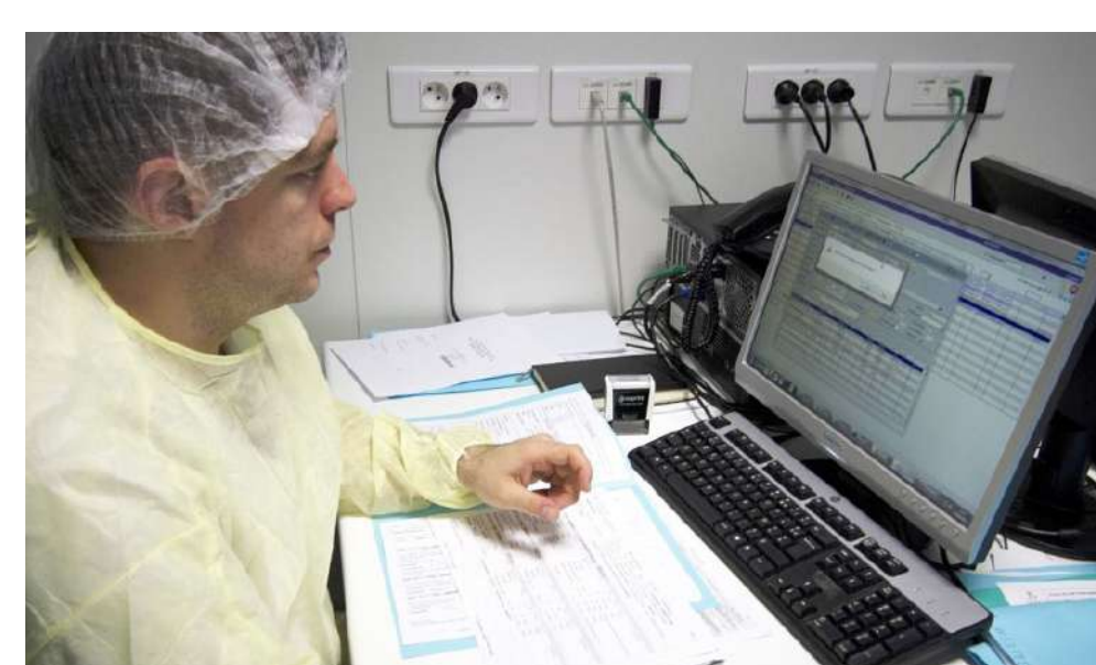
2. Validation pharmaceutique